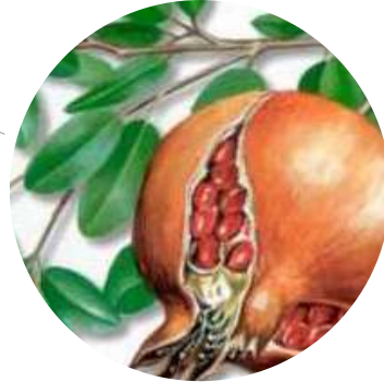
Fotografías de otros proyectos realizados.