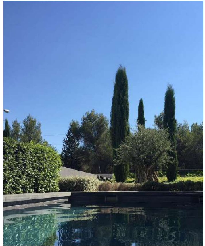
Fotografía de otro proyecto realizado.

Las especies arbustivas elegidas son: Fornios, Fotinias, Penisetum, Bolas de Boj, Agapantos...todos ellos aportan formas definidas arquitectónicas de distintas texturas y colores.